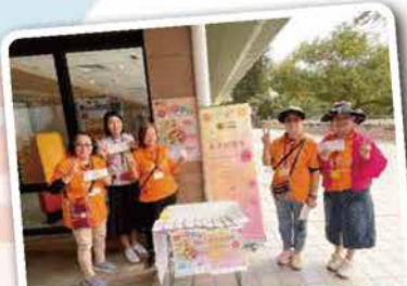
2025 明愛慈善抽獎券公開售賣