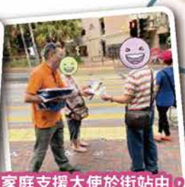
家庭支援大使於街站中，介紹本中心服務讓街坊認識