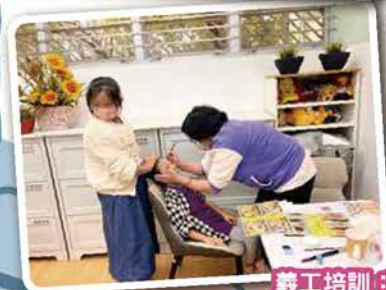
義工培訓：面部彩繪