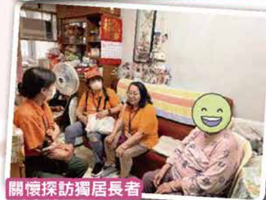
關懷探訪獨居長者