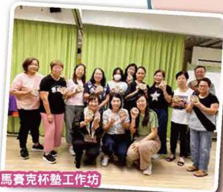
馬賽克杯墊工作坊