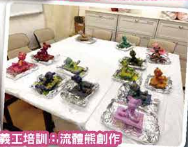
義工培訓：流體熊創作